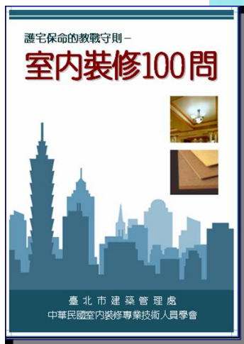
室內裝修 100 問

《室內裝修100問》初版於去年(97年)11月發行2萬本，採「Q&A」方式彙整成100個提問，內容深入淺出、圖文並茂，不僅社會大眾讀者受益，更是媒介各式建材與室內裝修從業者的最佳宣傳平台。本會再此熱情邀請各室內裝修從業業者及相關廠商共襄參與本次手冊的印製，共同推展室內裝修法令與制度的落實。