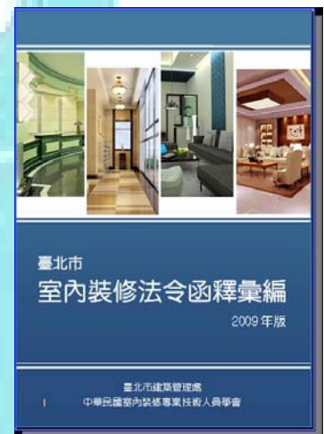
室內裝修法令函釋彙編

本會訂於98年11月19、20日假中油大樓國光會議廳舉辦「建築物室內裝修專業技術法令研習會」，並同步出版《室內裝修法令函釋彙編》。凡參與本研習會者皆可免費索取《臺北市建築物室內裝修法令研習會講義彙編》、《護宅保命的教戰守則—室內裝修100問》及《臺北市室內裝修法令函釋彙編2009年版》等三種書冊，不僅物超所值，更是建築師與專業人員不可或缺的工具書，請把握機會！