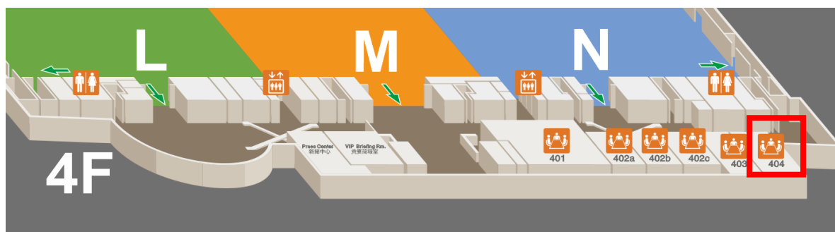
圖 2. 優良綠建築論壇位置圖 (南港展覽館 4 樓 404 會議室)