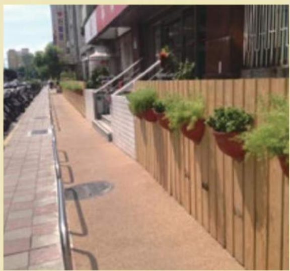
莒光新城人行道透水鋪片改善現況

減少積水面積，提高民眾行走安全，同時，藉由良好的透水鋪面，調節氣溫、提升地下水源之涵養量，落實基地保水之目的。